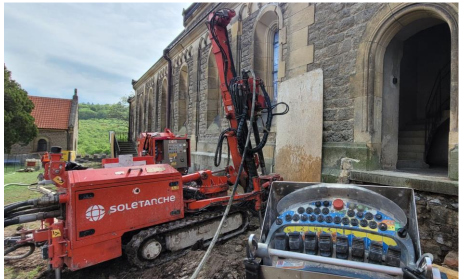
Realizace tryskové injektáže při fasádě kostela