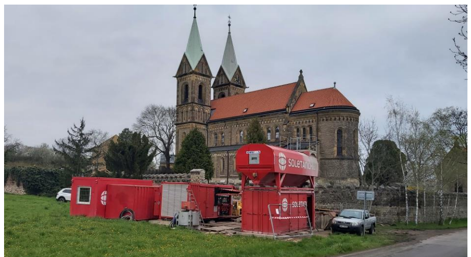
Celkový pohled na kostel v Gruntě a zařízení staveniště pro tryskovou injektáž