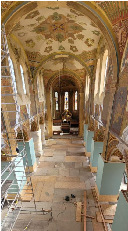
Přípravné práce v interiéru kostela