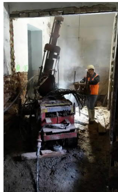
Realizace pilířů tryskové injektáže a mikropilot v interiéru objektu