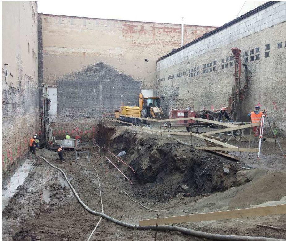
Realizace prvků zajištění stavební jámy

Realizace prací v relativně stísněném prostředí vnitřního dvora objektu a tím minimalizace plochy záboru komunikace před objektem ve vytížené ulici. Veškerá doprava materiálů, strojů a výkopku přes prostorově omezený průjezd domu.