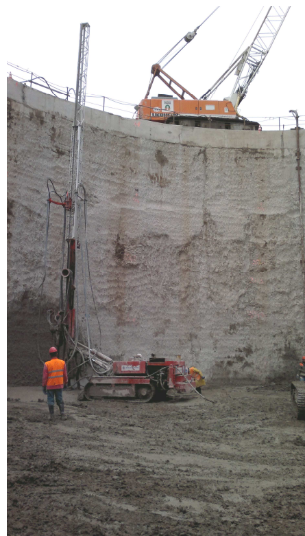
Provádění tryskové injektáže