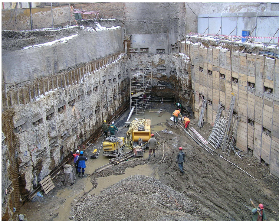
Pohled na stavební jámu kotvenou dočasnými lanovými kotvami: levá strana zajištěna tryskovou injektáží, pravá strana zajištěna záporovým pažením

Kotvení hluboké stavební jámy v proluce kotveným záporovým pažením. Zápory typu I 180. Stabilizace sousedních objektů podchycením tryskovou injektáží. Pilíře tryskové injektáže průměru 700 a 850 mm vyztuženy ocelovou trubkou pr. 108/12,5 mm.