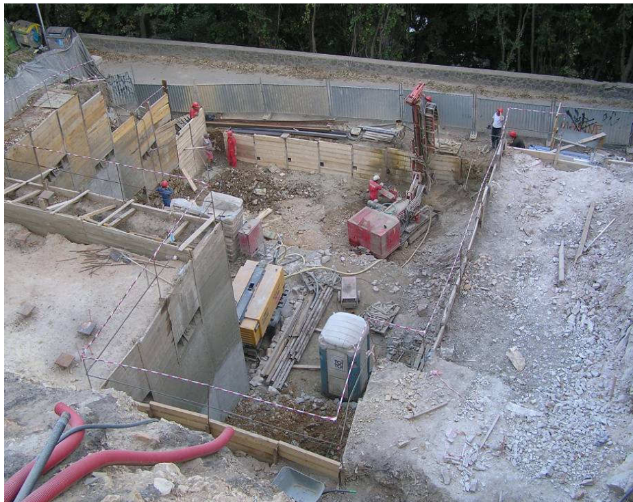
Pohled na stavební jámu

Mikrozápory ..... 488,5 m (66 ks, I 160) Dočasné kotvy ..... 320 m (32 ks, 2 až 4-pramencové) Stříkaný beton ..... 420 m 2 (tl. 100 – 200 mm s výztuž. sítí) Hřebíky ..... 150 m (ocelové trny 2x R16) Podkladní beton..... 800 m 2 Výkopy ..... 3575 m 2