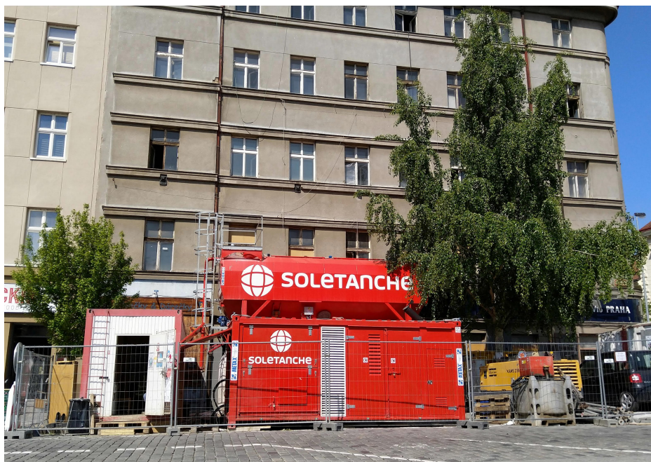
Zařízení staveniště a rekonstruovaný objekt

Realizace tryskové injektáže probíhala z úrovně suterénu v relativně obtížně dostupném a stísněném prostoru.