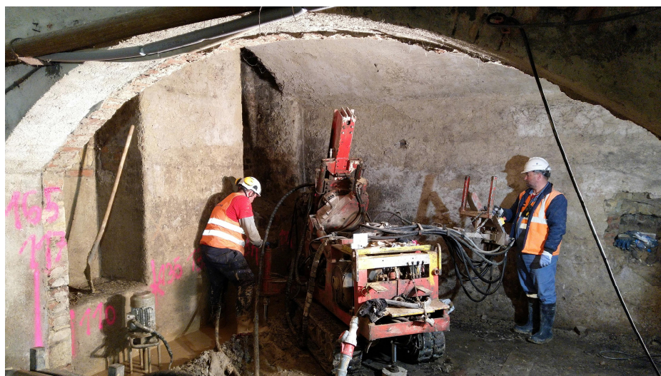
Realizace pilířů tryskové injektáže