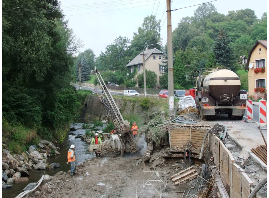
Provádění tryskové injektáže v toku potoka

Provedení sanačních prací opěrné zdi po povodni podél Jílovského potoka. Ochranná těsnící clona před opěrnou zdí proti podemletí základu pomocí pilířů tryskové injektáže a výplň prostorů pod podemletým základem opěrné zdi pomocí pilířů tryskové injektáže. Práce v toku potoka z dočasného náspu.