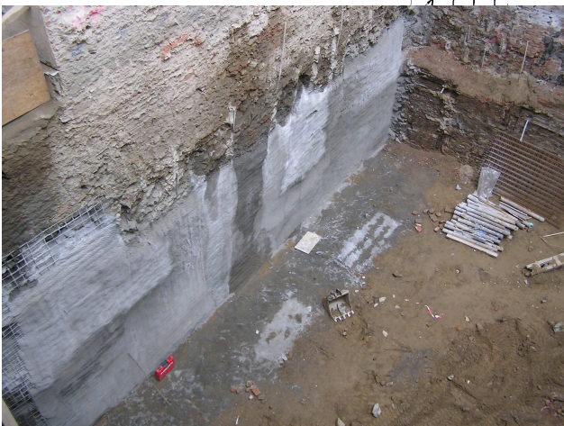
Pohled na zajištěnou jámu