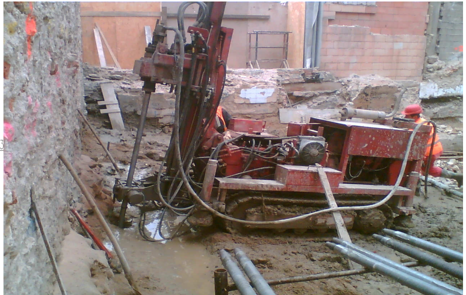
Provádění tryskové injektáže v nádvoří

POPIS: Zajištění stavební jámy kotvenou tryskovou injektáží a podchycení stávajícího objektu mikropilotovými barkami.