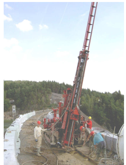
Provádění trykové injektáže