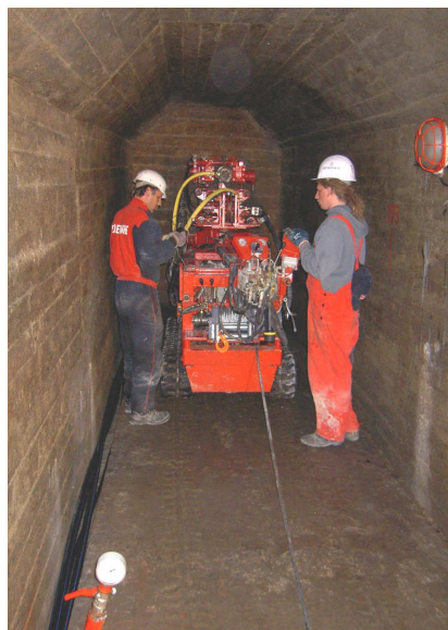
Vrtání ve štolě

Potvrzujeme, že stavba byla provedena podle zadání a požadavků objednatele, a to bez vad a nedodělků, v požadované kvalitě v souladu s platnými předpisy a prováděcí dokumentací.