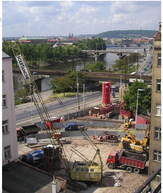
Pohled na staveniště – hloubení pro podzemní stěny