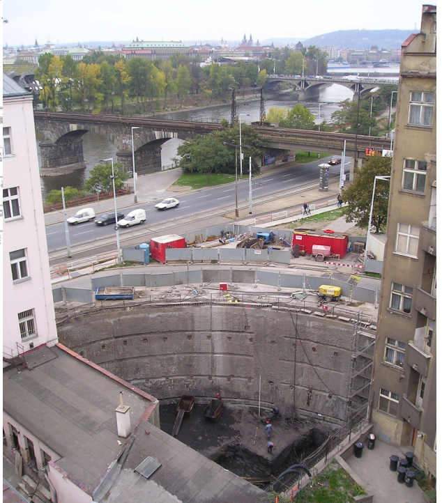
Kotvené podzemní stěny na jihozápadní stěně