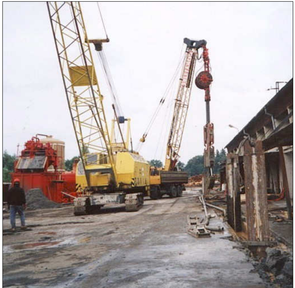
Realizace těsnících podzemních stěn